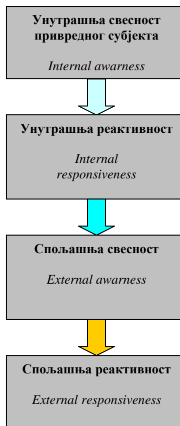
Слика 2. Ланац знања

Добро коцнипиран менаџмент знањем у привредном субјекту треба да омогући креирање ланца знања који се састоји из следећих елемената: